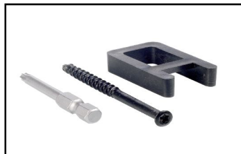
Gecko-Befestigungssystem siehe Seite 4.14 - 4.15